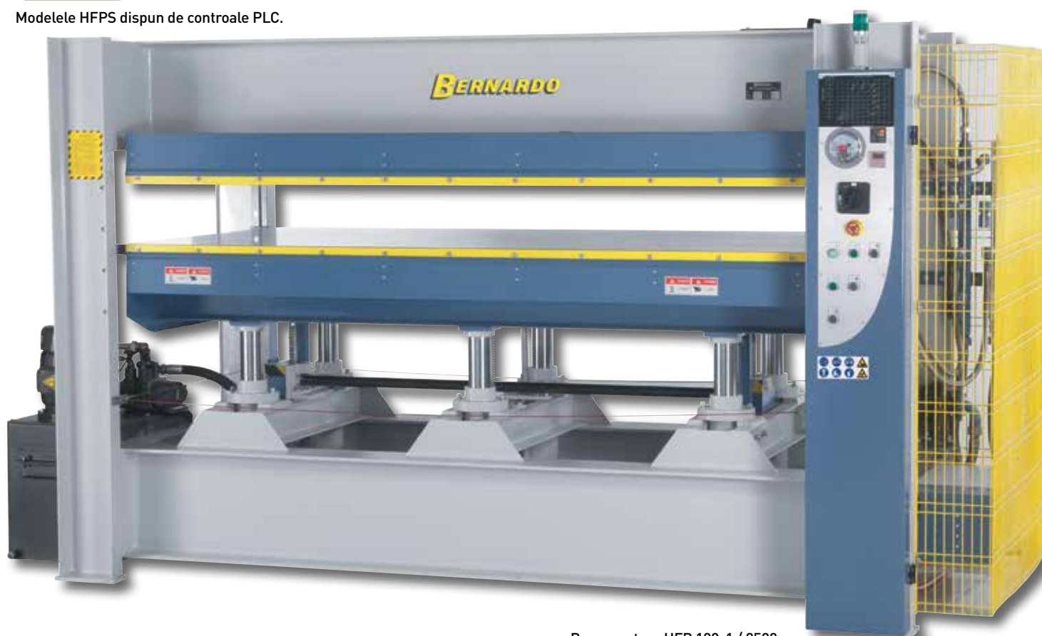
Reprezentare HFP 100-1 / 2500