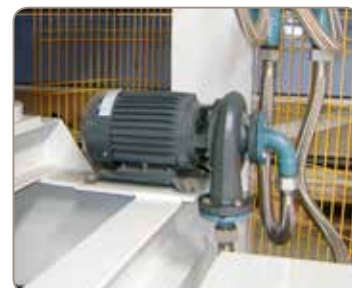
Pompă de transport ulei pentru ulei termic

Modelele HFPS dispun de controale Siemens PLC