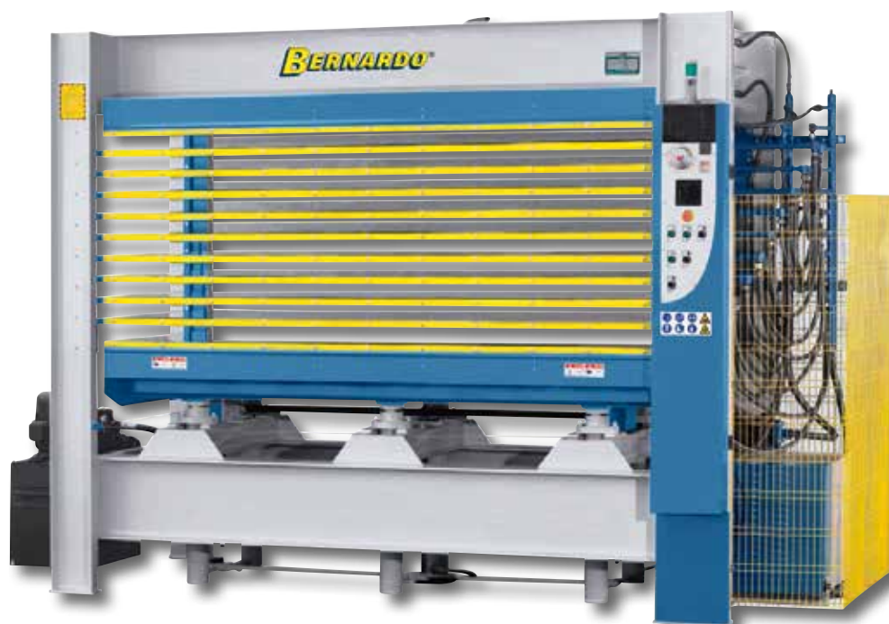
Imagine reprezentativa cu modelul HFPS 100 cu 10 nivele.

Reglarea parametrilor se realizează la partea frontală a mașinii (HFP-model)